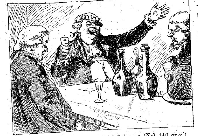
«Ο Τσάρλεϋ, έχων την πρωτοκαθεδρίαν...» (Σελ. 110, σ. γ')